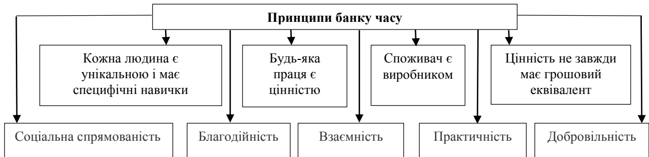
Рис. 1. Принципи створення й функціонування банку часу

базових товарів та послуг, соціальних труднощів і забезпечити відродження місцевих громад (communities). Основні принципи банку часу можна представити в такий спосіб (рис. 1).