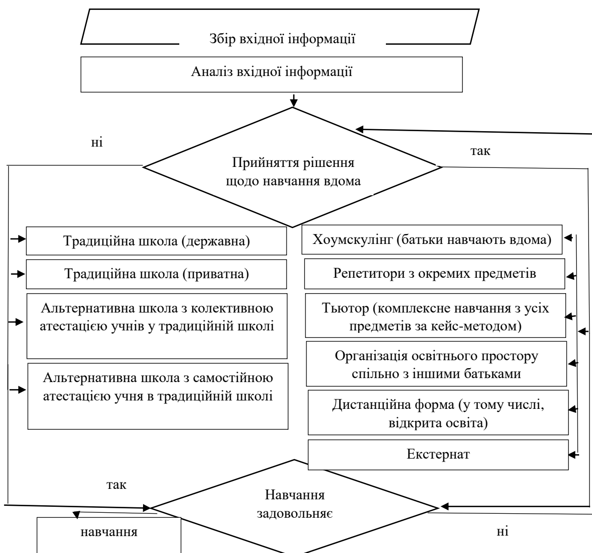
Рисунок 2 – Алгоритм прийняття рішення про перехід на домашнє навчання (хоумскулінг)

Таким чином, враховуючи ці ознаки, а також в умовах дефіциту інформації стосовно юридичних та організаційних питань, батьки знаходяться в інформаційному вакуумі щодо процесу переходу дитини на домашнє навчання (хоумскулінг). На рис. 2 запропоновано алгоритм прийняття рішення про переведення дитини на домашнє навчання (хоумскулінг).