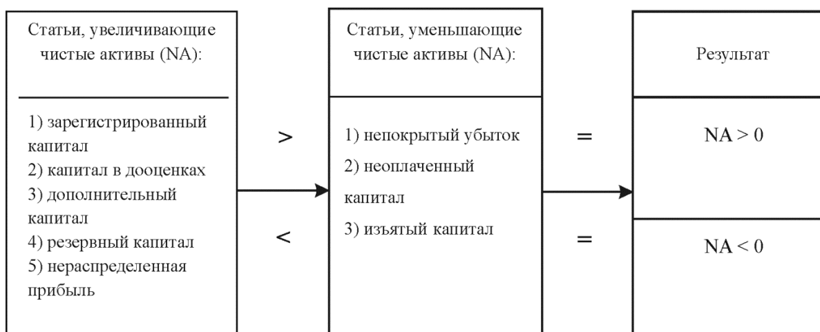
Рис.3. Формирование результата чистых активов при постатейном анализе

денег, поступающих от операций компании» [4, с.259].