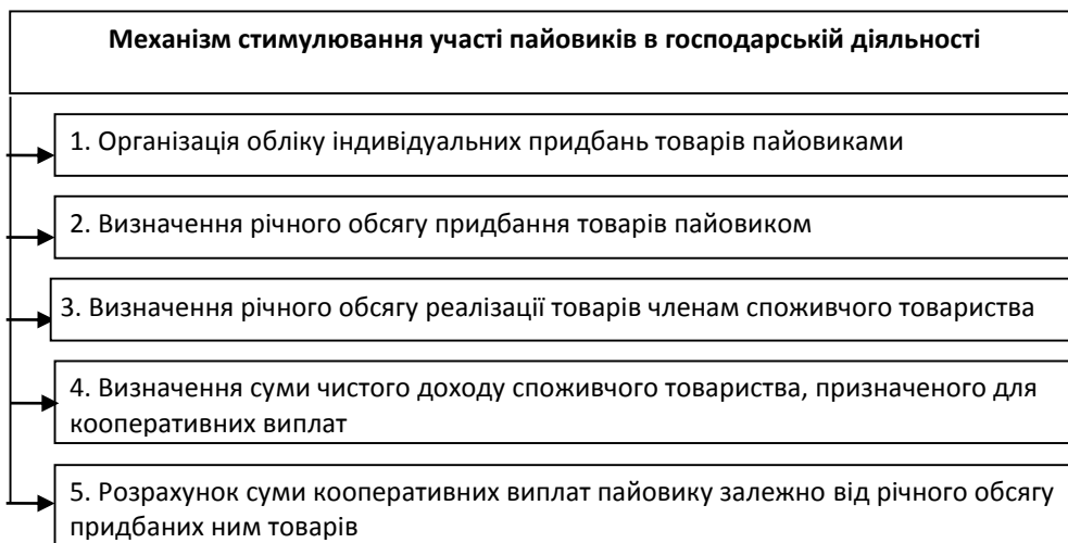
Рис. 1. Алгоритм запровадження механізму стимулювання участі пайовиків в господарській діяльності споживчого товариства (розроблено автором)

В узагальненому вигляді алгоритм запровадження механізму стимулювання участі пайовиків в господарській діяльності споживчого товариства може бути представлений наступним чином (рис.1).