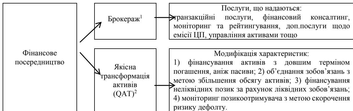
Рис. 1. Класифікація фінансового посередництва за видами діяльності та послуг, що надаються

Відповідно до характеристик їх діяльності та видів послуг, що надаються, інститути фінансового посередництва можна поділити на дві групи (рис. 1):