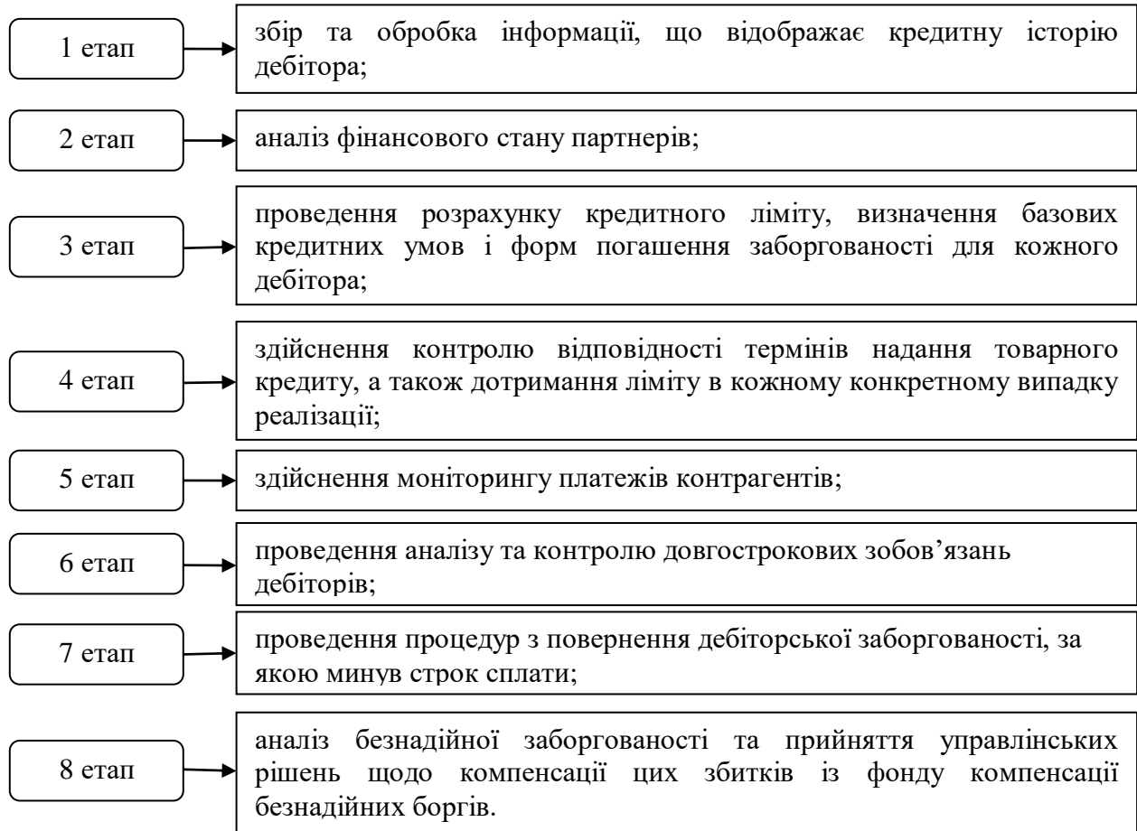
Рисунок 1 - Етапи проведення аналізу дебіторської заборгованості Сформовано авторами на основі джерела [1]

Вважаємо, що комплекс завдань та послідовність проведення аналізу дебіторської заборгованості підприємства можна представити схематично на рисунку 1.